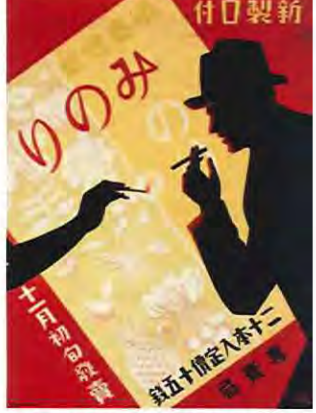
「新製口付 紙巻煙草みりのり」(昭和5年(1930)・たばこ塩の博物館)