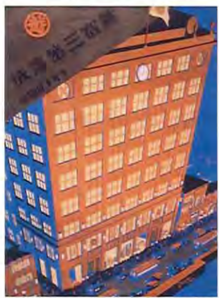
「新宿三越落成 十月十日開店」(昭和5年(1930)・愛媛県美術館)