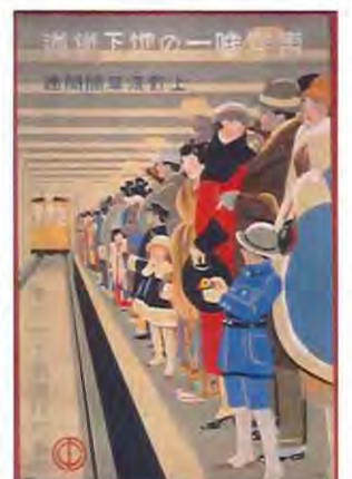
「東洋唯一の地下鉄道 上野浅草間開通」(昭和2年(1927)・愛媛県美術館)