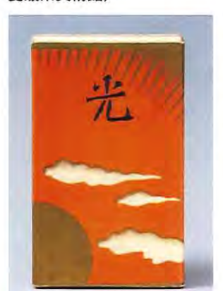
「光」(昭和11年(1936)＝商品発売年・たばこ塩の博物館)

東京都墨田区の「たばこ塩の博物館」では、本紙9月号4面で既報のとおり、9月11日から11月14日まで、特別展「杉浦非水 時代をひらくデザイン」が開かれています。本紙では、特別展の開催にあたり、その中身などについて紹介する。 杉浦非水(明治9年11月8日〜昭和40年11月19日)は、日本におけるモダンデザインのパイオニアとして知られており、明治41年(1908)に