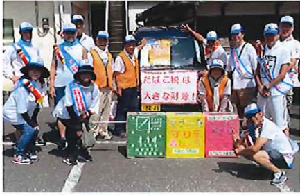
参加者のみなさん。タスキに種子島のシンボル・ロケット人形も

「今できることをやる」をモットーに 「20歳未満喫煙禁止」等の啓発活動 鉄砲伝来のパレードに参加して、炎の徹底・たばこの税の財政の貢献・喫煙マナー向上への20歳未満喫煙防止を携帯灰皿、ポケットティッシュを配付しながら