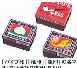
「パイプ印」「桃印」「象印」の各マッチ(株式会社日東社HPより)

その詳細は、登録番号が第五〇七号、登録日は明治43年(1910)7月29日、出願日は明治43年(1910)6月22日、残存期間満了日は令和2年(2020)7月29日、商標は「牌桃」、権利者は兼松日産農林株式会社 ラベルの中で、日本国内でよく見かけるのが「桃印」のマッチである。このデザインがいつごろから使用されたのかが気になって調べたところ、図の商標は明治43年(1910)に登録されていたことが分かった。