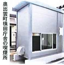
奥出雲町横田庁舎の喫煙所

島根県奥出雲町は、2005年に仁多町と横田町が合併、両町に庁舎が設けられていた。2021年、仁多庁舎には喫煙所が設置されたものの、横田庁舎には設置されなかった。 そのため、出雲組合(大島治理理事長)では、横田町の庁舎にも喫煙所を設置するよう再三再四、強く要望を行った。 その結果、2022年には奥出雲町総務課が中心となって喫煙場所設置推進に向けた予算化が実現し、2023年3月、奥出雲町の経費で喫煙所を設置することができた(スタンド灰皿はJT島根支社の協力による寄贈)。 なお、出雲組合では、毎年7月に行われる「出雲たばこ販売協議会雲南支部(雲南市・仁多郡・飯石郡)」の総会において、出席する市町村の首長・税務課長等に、たばこの販売状況、たばこ税の状況などを説明し「たばこへの理解促進」に努めている。