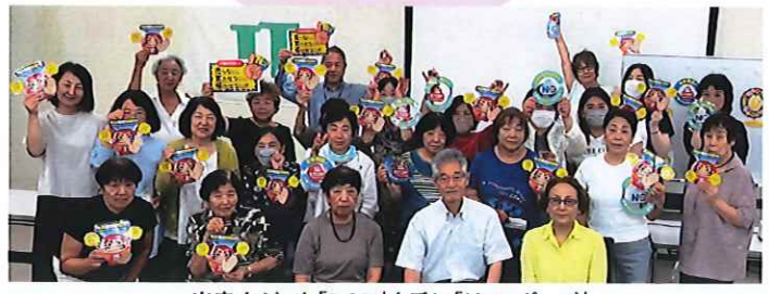
出来上がった「POP」を手に「はい、ポーズ」