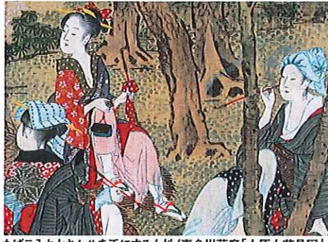
たばこ入れとキセルを手にする女性(喜多川藤麿「大原女花見図」、19世紀前半頃の作品)

たばこ塩の博物館では、4月27日から6月30日まで、「時代とあゆむ袋物商」— たばこ入れからハンドバッグまで—展を開催している。和装が主流だった時代、貴重品や懐紙、たばこなどを携帯する際には袋物を用いられ、これらは懐に収めたり、腰から提げたりして使い、装身具としても重要なものであり、たばこ入れは構成部品が多く、各部品にさまざまな素材が用いられることから凝った装飾のものが多く作られた。本紙では、特別展の中の「たばこ入れ」に焦点を当て、用と美を兼ね備えた美術工芸品としての「たばこ入れ」を紹介する。