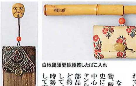
白地鶏頭更紗履差したばこ入れ

16世紀末にたばこが伝来し、喫煙習慣が定着していき、喫煙に必要となる道具も携帯されるようになった。当時は既存の袋物を転用していたが、やがて専用の「たばこ入れ」が登場した。たばこ入れは次第に装身具の性格を帯びるようになり、ついには幕府の奢侈禁令に触れるほど素材や細工に凝ったものが作られるようになった。