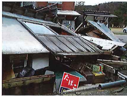
被害を受けたたばこ店

能登半島地震で特別見舞金 全壊、大規模半壊の契約者に 全国たばこ販売生活協同組合(益田龍朗会長)以下、たばこ生協では、4月24日に開催された理事会において、令和6年能登半島地震における特別見舞金について審議した結果、原案のとおり了承、能登半島地震 全国たばこ販売生活協同組合(益田龍朗会長)以下、たばこ生協では、4月24日に開催された理事会において、令和6年能登半島地震における特別見舞金について審議した結果、原案のとおり了承、能登半島地震