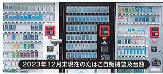
2023年12月末現在のたばこ自販機普及台数

のために、傘下12組合と連合会の事務所壁面等に地方たばこ税額の看板を設置した。看板は地域住民ばかりか組合員等に対しても、地方たばこ税が地元市町村の貴重な財源であるとの認知度及び理解度向上に寄与した。