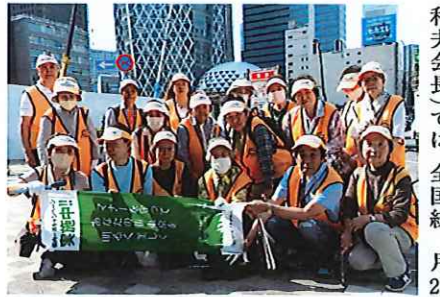
新宿駅西口での美化活動に参加したみなさん