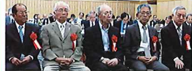
表彰された各部門の代表者

全国たばこ販 売生活協同組合 表彰と交通災害共済55周年 特別表彰が6月5日、東京都市センターホテルで行われ、「火災生命共済」、「交通災害共済」部門並びに交通災害共済55周年特別表彰として「純増口数」(純増口数増加割合)部門それぞれの優良組合が表彰された(本紙6月号既報。お詫びと訂正 本紙6月号6面の「たばこ生協の年間表彰」の記事で、「純増口数増加割合」部門第3位の杵築組合(熊本支部)が漏れておりました。お詫びして訂正いたします。