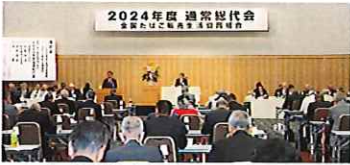
2024年度 通常総代会 全国たばこ協会 東京市会館