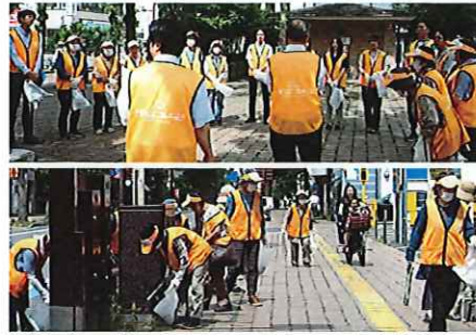
高松組合—「さあ、みなさん、頑張ってください！」(左)。 美化活動などを展開中(右)。