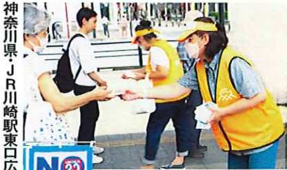
神奈川県JR川崎駅東口広場でのイベント

も1兆5908億円で、1456億円、10.1%の増加である。直近の市場占有率は2020年度以降、27.0%、30.8%、35.0%そして2023年度は39.2%と、40%に迫る勢いを示した。販売代金の構成比率も数量とほぼ同率である。たばこ市場の約4割を占める加熱式たばこの販売は、企業系小売店(コンビニ等)が大きなウエートを占め、一般販売店からの顧客流出が加速しているといわれる。ある一般販売店(組合員)は「加熱式たばこに転移する顧客が多くなり、コンビニに大刀打ちできないのが現状だ。当店で加熱式たばこの取扱いは銘柄を増やすとともにデバイスも販売したい。しかし、顧客との対話のキッカケとなる紙巻たばこ上位20銘柄販売実績(3面掲載)のような売れ筋商品がわからない。早急に上位銘柄を開示してほしい」と要望している。