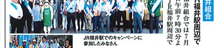
JR福井駅でのキャンペーンに参加したみなさん

街頭キャンペーンを実施。当日は、福井組合の役員12名と北陸財務局福井財務事務所、JT福井支社、日本フランチャイズチェーン協会(コンビニ3社)など総勢22名が参加、通学する高校生等に活動を展開した。 小松加賀組合では、7月3日午前7時30分より、JR小松駅周辺で街頭キャンペーンを実施。当日は、小松加賀組合の役員6名、北陸連合会1名とJT石川支社、日本フランチャイズチェーン協会(コンビニ2社)など総勢11名が参加し活動を展開した。 JR小松駅でのキャンペーンに参加したみなさん