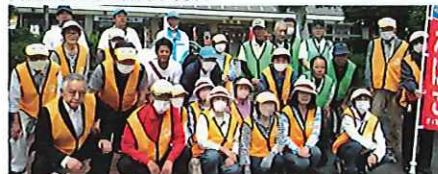
松山組合—松山駅での美化活動などに参加したみなさん(左)。 美化活動などを展開中(右)。

組合では「吸う人吸わない人の共存を目指しつつ、環境美化活動を通して、マナーの向上を訴えている。当日の模様は、RNC西日本放送で取り上げられ、香川県内では、他の2か所でも地元組合が美化活動を展開した。