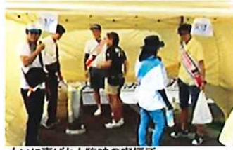
大いに喜ばれた臨時の喫煙所

10名が参加。喫煙所を設置後、「20歳未満喫煙防止」や「喫煙マナー啓発」を訴えながら、携帯灰皿やティッシュを配布。また、屋根のない所に設置されており、組合としてはかなり気になるため、今年は、分煙環境を整えることを目的に、安心してゆったりと喫煙できるように、かなりのスペースを取り、テントを張って喫煙所を設置したところ、市役所職員の方や愛煙家のみなさん大いに喜ばれた。