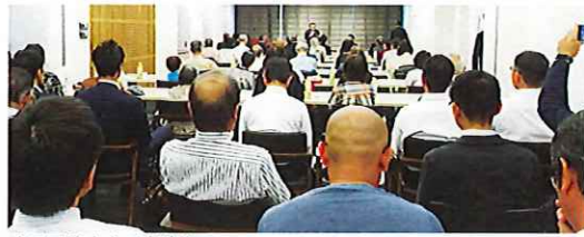
南四国連合会の座談会

全国68主要都市で啓発イベント実施 去る7月の1か月間にわたって実施された「20歳未満喫煙防止強化月間」において、たばこ組合主導の街頭啓発イベントに全国68都市で約17000人が参加した。 同イベントは、行政・関係機関等と協働して地域社会に「20歳未満喫煙禁止」を幅広く訴える、社会貢献活動として毎年実施され、社会的に高い評価を得ている。 今年度の68都市の活動総参加者は1718人。内訳はたばこ組合関係者(全協連合会単位組合