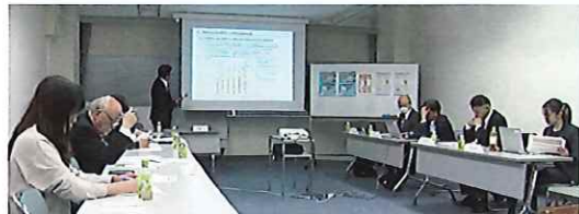
埼玉県連合会が行政交えて意見交換

2025年3月 March第947号 ■発行元/全国たばこ販売協同組合連合会 〒105-0014 東京都港区芝1丁目6番10号 芝SIAビル7階 TEL.03(5476)7551 ■企画編集責任/株式会社アーネスト 〒105-0004 東京都港区新橋6-9-2 新橋第一ビル TEL.03(3432)8346