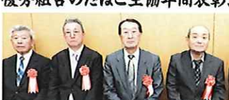
右から、荒尾組合、菊池組合、岩手県組合盛岡支部、福知山組合、長崎県組合諫早支部の代表者のみなさん

全国たばこ販売生活協同組合の通常総代会において、2024年度加入促進成績優秀組合の年間表彰式が行われた。 今回表彰されたのは、本紙6月号既報のとおり、火災生命共済部門1位の荒尾組合(熊本支部)と菊池組合(熊本支部)、「交通災害共済」部門1位の岩手県組合盛岡支部(東北支部)と2位福知山組合(関西支部)、3位の長崎県組合諫早支部(福岡支部)。